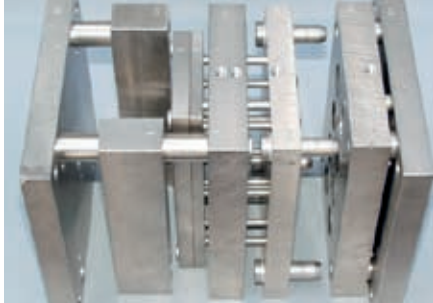
Bild 4 Beschichtung Komplettwerkzeug

HCN oder CNV wird bei der Verarbeitung abrasiver, gefüllter Kunststoffe eingesetzt. Zudem können „weiche“ Grundwerkstoffe wie z.B. ungehärteter Stahl, Kupfer und Aluminium geschützt werden.