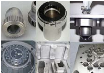
Bild 5 Beispiele NP-Beschichtungen