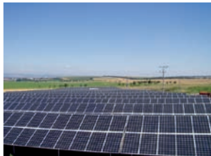
Bild 2 Solarkraftwerk Südmähren